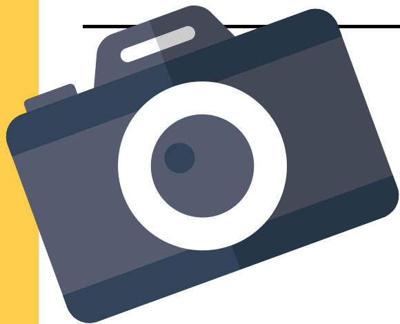
사진 속에는 얼굴 , 장소 를 비롯해 나의 개인 정보들이 가득 들어 있어요!

내가 보낸 사진을 합성하여 악용하거나 나에 대해 알아낸 정보들을 이용해 범죄 피해가 일어날 수 있어 조심해야 해요!